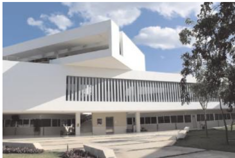
Figura 1 Fachada de la Facultad de Educación Unidad Mérida

Actualmente, esta facultad ofrece programas educativos en la Unidad Mérida (Ver figura 1) como parte del Campus de Ciencias Sociales, Económico-Administrativas y Humanidades (CCSEAH) y en la Unidad Multidisciplinaria Tizimín (Ver figura 2). Ofrece dos programas educativos de licenciatura (Licenciatura en Educación y Licenciatura en Enseñanza del Idioma Inglés) y tres programas educativos de posgrado (Especialización en Docencia, Maestría en Investigación Educativa y Maestría en Innovación Educativa).